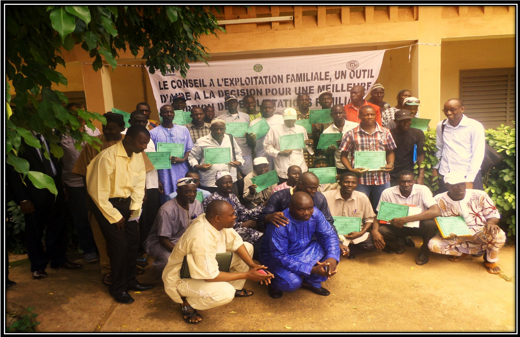
PHOTO DE GROUPE DES PARTICIPANTS